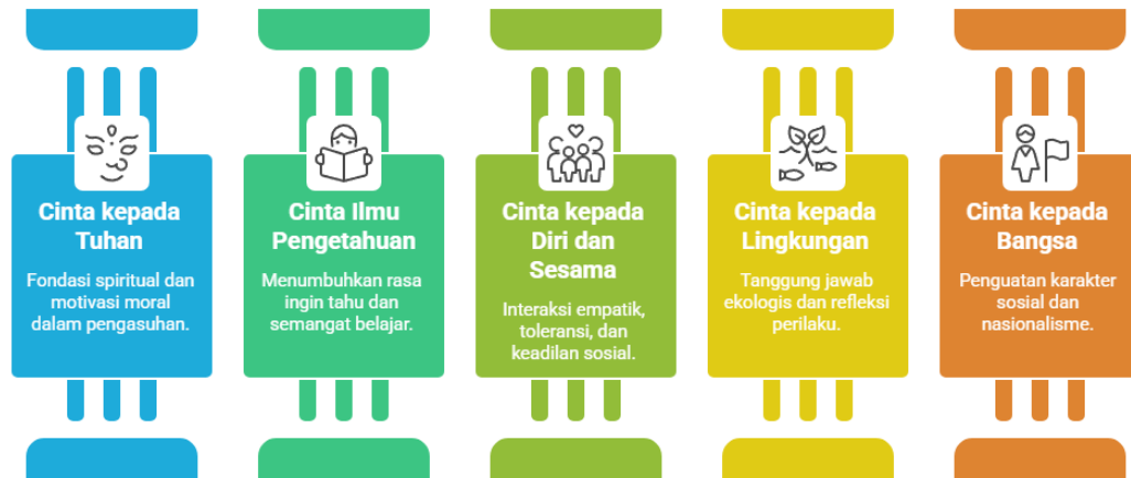
Gambar 4. Konsep Panca Cinta dalam Pengasuhan

Observasi interaksi anak-pengasuh menunjukkan peningkatan kualitas komunikasi, konsistensi emotional attunement, dan responsivitas anak terhadap kebutuhan relasional. Tim PkM memfasilitasi praktik terpandu dengan umpan balik langsung dan strategi adaptif, memperkuat keterampilan pengasuh dalam penerapan nilai Kurikulum Cinta. Aktivitas pengalaman langsung memungkinkan internalisasi nilai spiritual dan sosial secara simultan, mendukung moderasi beragama, keharmonisan sosial, dan pembentukan karakter berkelanjutan. Prinsip self-reflective practice dan empathic resonance yang diterapkan pengasuh berdampak positif pada kualitas pengasuhan jangka panjang dalam mengelola stres dan beban emosional yang terkait dengan pengasuhan. Praktik ini memungkinkan pengasuh untuk mengidentifikasi dan memenuhi kebutuhan mereka sendiri, yang pada gilirannya meningkatkan kesehatan mental dan mengurangi beban pengasuhan. [17] Hubungan emosional ini memperkuat hubungan antara pemberi pengasuhan dan penerima pengasuhan, yang pada gilirannya menghasilkan perawatan yang lebih personal dan penuh kasih sayang.