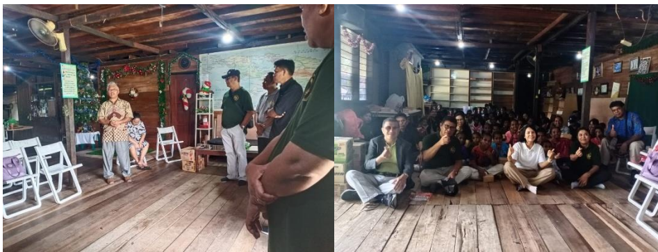
Gambar 4. Implementasi Kurikulum Berbasis Cinta Melalui Sosialisasi

Observasi interaksi anak-pengasuh menunjukkan peningkatan kualitas komunikasi, konsistensi emotional attunement, dan responsivitas anak terhadap kebutuhan relasional. Tim PkM memfasilitasi praktik terpandu dengan umpan balik langsung dan strategi adaptif, memperkuat keterampilan pengasuh dalam penerapan nilai Kurikulum Cinta. Aktivitas pengalaman langsung memungkinkan internalisasi nilai spiritual dan sosial secara simultan, mendukung moderasi beragama, keharmonisan sosial, dan pembentukan karakter berkelanjutan. Prinsip self-reflective practice dan empathic resonance yang diterapkan pengasuh berdampak positif pada kualitas pengasuhan jangka panjang dalam mengelola stres dan beban emosional yang terkait dengan pengasuhan. Praktik ini memungkinkan pengasuh untuk mengidentifikasi dan memenuhi kebutuhan mereka sendiri, yang pada gilirannya meningkatkan kesehatan mental dan mengurangi beban pengasuhan. [17] Hubungan emosional ini memperkuat hubungan antara pemberi pengasuhan dan penerima pengasuhan, yang pada gilirannya menghasilkan perawatan yang lebih personal dan penuh kasih sayang.