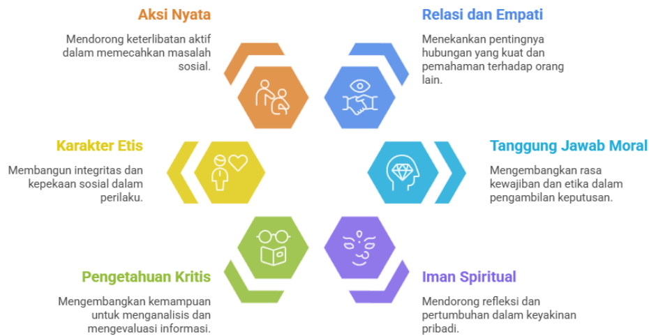
Gambar 2. Fondasi Pendidikan KBC

sehingga menghasilkan praksis hidup yang berdampak, baik pada level personal maupun sosial. Paradigma ini dapat digambarkan pada gambar konsep di bawah ini: