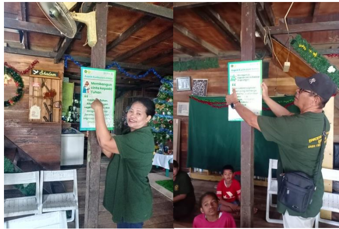
Gambar 3. Edukasi Panca Cita dalam Kurikulum Berbasis Cinta

Pengamatan selama pelatihan menunjukkan bahwa pengasuh mulai mampu menyesuaikan perilaku mereka berdasarkan kebutuhan emosional anak dan situasi sosial di panti. Mereka lebih mampu mengidentifikasi konflik kecil, memberikan respons yang menenangkan, dan memfasilitasi interaksi yang inklusif. Temuan ini menunjukkan bahwa edukasi bukan sekadar pengetahuan, tetapi medium untuk membangun kapasitas reflektif, empati, dan keterampilan praktis yang menjadi fondasi pembentukan karakter.