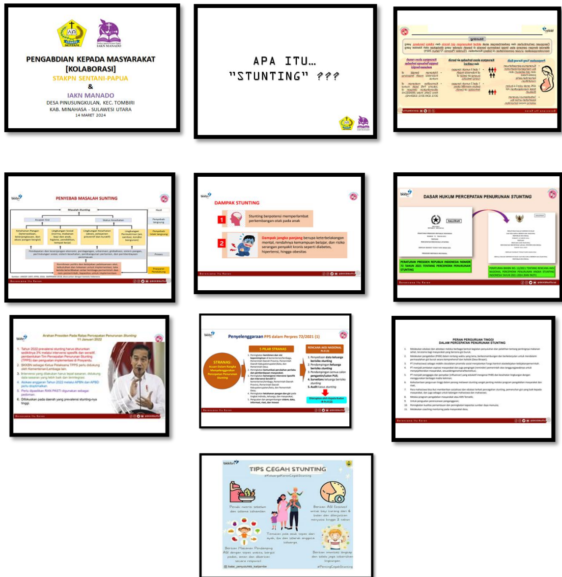
Gambar 1. Materi Sesi Pertama Pencegahan Stunting

Materi disajikan menggunakan media PowerPoint, video edukatif singkat, dan leaflet bergambar agar mudah dipahami oleh peserta dari berbagai latar belakang pendidikan.