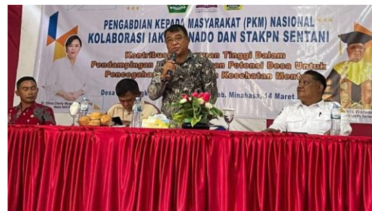
Gambar 6. Sesi Kedua Penyampaian Materi Kegiatan