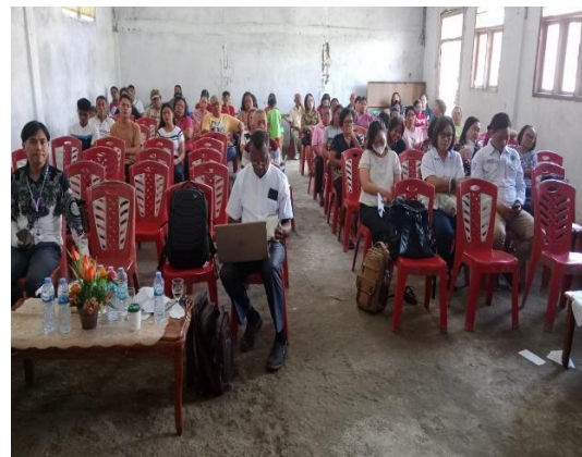
Gambar 4. Pelaksanaan Pembukaan Kegiatan