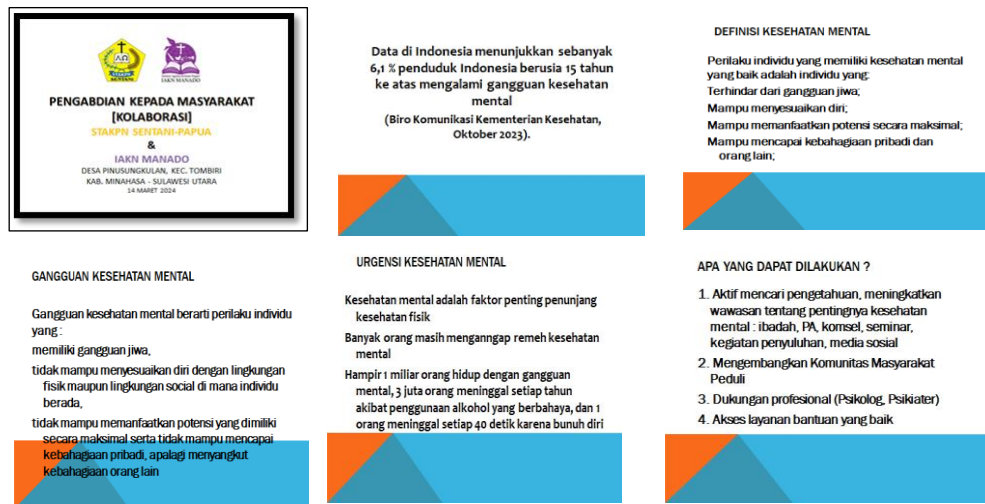
Gambar 2. Materi Sesi kedua pencegahan kesehatan mental