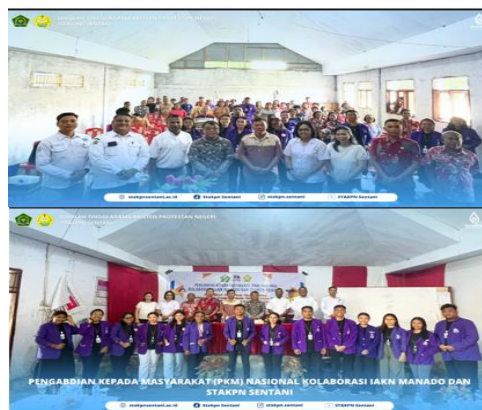
Gambar 7. Sesi Kedua Penyampaian Materi Kegiatan