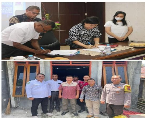
Gambar 3. Koordinasi dan Observasi Dengan Mitra Kegiatan

Selanjutnya, tahapan evaluasi memperlihatkan hasil yang menggembirakan, di mana seluruh peserta menunjukkan peningkatan skor pengetahuan dan sikap positif terhadap isu gizi dan kesehatan mental. Melalui observasi lapangan dan wawancara reflektif, ditemukan perubahan perilaku sederhana seperti peningkatan kebiasaan sarapan bergizi, manajemen waktu keluarga, dan penerapan dukungan emosional antaranggota rumah tangga. Peserta menilai kegiatan ini bukan hanya bermanfaat secara ilmiah, tetapi juga memperkuat nilai-nilai spiritual dalam kehidupan keluarga. Refleksi bersama juga memunculkan kesepakatan untuk membentuk Kelompok Jemaat Peduli Gizi dan Kesehatan Mental, yang menjadi indikator utama keberhasilan transformasi sosial-komunal. Kegiatan ini membuktikan bahwa pendekatan partisipatif tidak hanya meningkatkan pengetahuan, tetapi juga memperkuat solidaritas komunitas.