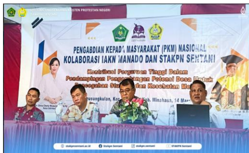
Gambar 5. Sesi Pertama Penyampaian Materi Kegiatan